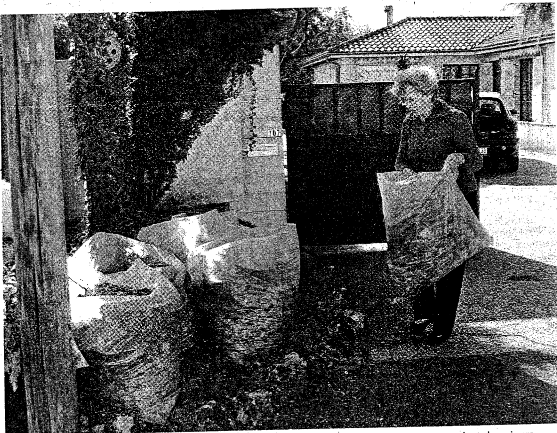
2 400 foyers mérignacais bénéficient du ramassage des déchets verts une fois par mois et pendant deux jours consécutifs

À l'heure actuelle, 2 400 foyers bénéficient de ce ramassage qui est organisé par secteur dans Mérignac. Pour chaque zone, une collecte est prévue en général une fois par mois, pendant deux jours consécutifs. Mais là encore,